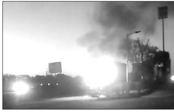
दिल्ली-अजमेर हाइवे पर बिलौची के पास कन्टेनर में आग लग गई।