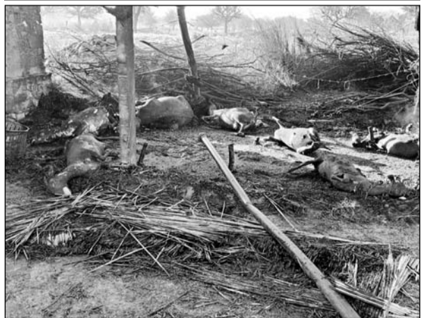
श्रीमाधोपुर के पास एक गांव में आग लगने से मवेशी जलकर मर गए।