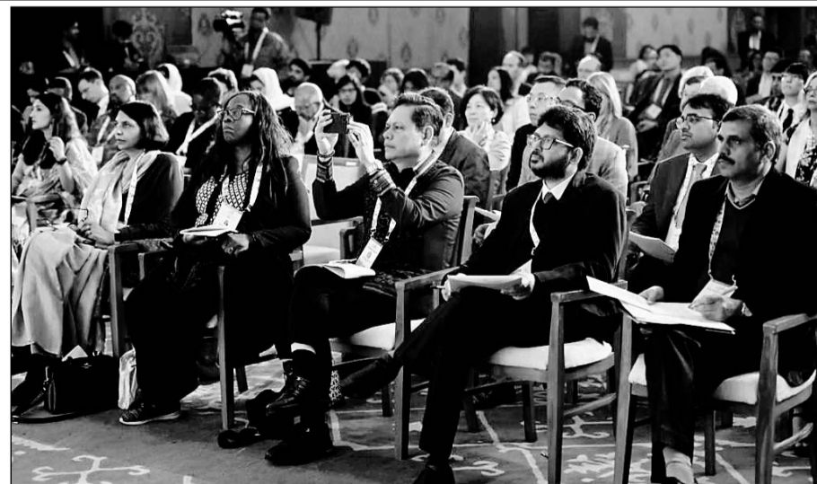
जोधपुर में शुरू हुए जी-20 शिखर सम्मेलन में विभिन्न देशों के राजनयिकों ने हिस्सा लिया।