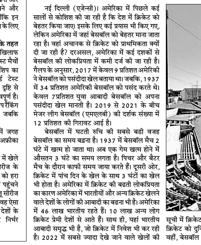
सूची में क्रिकेट दूसरे नंबर पर है। आंकड़ों के अनुसार, क्रिकेट को दुनियाभर में 250 करोड़ दर्शक देखते हैं। वहीं, बेसबॉल इस सूची में 8वें स्थान पर है। बेसबॉल की दर्शक संख्या 50 करोड़ है, जो क्रिकेट की दर्शक संख्या के केवल 20 प्रतिशत है। अमेरिका में भारतीय मूल के टेक्नोलॉजी दिग्गज

नई दिल्ली (एजेन्सी)। अमेरिका में पिछले कई सालों से कोशिश की जा रही है कि देश में क्रिकेट को बेहतर किया जाए। इसके लिए कई प्रयास भी किए गए, लेकिन अमेरिका में जहां बेसबॉल को बेहतर माना जाता रहा है। वहां अचानक से क्रिकेट को प्राथमिकता क्यों दी जा रही है? दरअसल, अमेरिका में कई दशकों से बेसबॉल की लोकप्रियता में कमी दर्ज की जा रही है। गैलप के अनुसार, 2017 में केवल 9 प्रतिशत अमेरिकी ने बेसबॉल को पसंदीदा खेल बताया था। जबकि, 1937 में 34 प्रतिशत अमेरिकी बेसबॉल को पसंद करते थे। केवल 7 प्रतिशत युवा आबादी बेसबॉल को अपना पसंदीदा खेल मानती है। 2019 से 2021 के बीच मेजर लीग बेसबॉल (एमएलबी) की दर्शक संख्या में 12 प्रतिशत की गिरावट आई है। बेसबॉल में घटती रुचि की सबसे बड़ी वजह बेसबॉल का समय बढ़ना है। 1937 में बेसबॉल मैच 2 घंटे में खत्म हो जाता था। अब एक गेम खत्म होने में औसतन 3 घंटे का समय लगता है। पिचर और बैटर मैच के दौरान काफी समय जाया करते हैं। दूसरी ओर, क्रिकेट में पांच दिन के खेल के साथ 3 घंटों का खेल भी होता है। अमेरिका में क्रिकेट की बढ़ती लोकप्रियता का कारण अमेरिका में भारतीयों और अन्य क्रिकेट खेलने वाले देशों के लोगों की आबादी का बढ़ना भी है। अमेरिका में 46 लाख लोग क्रिकेट खेलते हैं। 10 लाख अन्य लोग क्रिकेट प्रेमी देशों से आते हैं। साथ ही, यहां भारतीय आबादी समृद्ध भी है, जो क्रिकेट में निवेश भी कर रही है। 2022 में सबसे ज्यादा देखे जाने वाले खेलों की