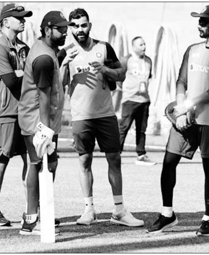
शॉर्टलिस्ट किए गए 20 प्लेयर्स के नाम अब तक जारी नहीं किए गए हैं।

हुई मॉनिंग करीब 4 घंटे तक चली। 2023 में टीम इंडिया के टारगेट पर भी ब्रेनस्टॉर्मिंग की गई। 2023 में भी मॉनिटर करेंगे। जसप्रीत बुमराह और दीपक चाहर की फिटनेस को लेकर अक्सर सवालिया निशान लगते रहे हैं। फिटनेस पर सख्ती बतेंगे:- मॉनिंग में एक बार फिर यो-यो टेस्ट को ही फिटनेस टेस्ट का पैमाना बताया गया है डिजाइड किया कि खिलाड़ियों को फिटनेस बहुत जरूरी है। टीम इंडिया का हिस्सा बनने के लिए उन्हें डेक्सा स्कैन और यो-यो टेस्ट पास करना भी जरूरी है। डेक्सा हड्डियों का स्कैन टेस्ट होता है और यो-यो टेस्ट में खिलाड़ियों को 20-20 मीटर के स्पिंट लगाने होते हैं। इंटरनेशनल क्रिकेट को प्राथमिकता:- प्रेसिडेंट रोजर बिन्नी ने वीडियो कॉन्फ्रेंसिंग के जरिए मॉनिंग अटेंड की। मॉनिंग में तय हुआ कि टीम इंडिया आने वाले दिनों में इंटरनेशनल क्रिकेट और बाइलैट्रल सीरीज को तवज्जो दी जाएगी। के सूत्रों ने बताया कि इस दौरान इंडियन प्रीमियर लीग पर भी ध्यान दिया जाएगा। में प्लेयर्स पर नजर रखेगा:- मॉनिंग में तय हुआ कि नेशनल क्रिकेट एकेडमी फ्रेंचाइजी के साथ मिलकर भारतीय खिलाड़ियों के खेल और फिटनेस को मॉनिटर करेंगे। खिलाड़ियों के वर्कलोड मैनेजमेंट को भी मॉनिटर करेंगे। जसप्रीत बुमराह और दीपक चाहर की फिटनेस को लेकर अक्सर सवालिया निशान लगते रहे हैं। फिटनेस पर सख्ती बतेंगे:- मॉनिंग में एक बार फिर यो-यो टेस्ट को ही फिटनेस टेस्ट का पैमाना बताया गया है डिजाइड किया कि खिलाड़ियों को फिटनेस बहुत जरूरी है। टीम इंडिया का हिस्सा बनने के लिए उन्हें डेक्सा स्कैन और यो-यो टेस्ट पास करना भी जरूरी है। डेक्सा हड्डियों का स्कैन टेस्ट होता है और यो-यो टेस्ट में खिलाड़ियों को 20-20 मीटर के स्पिंट लगाने होते हैं।