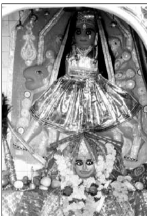
गुगोर स्थित बीजासन माता।

छबड़ा, (निर्स)। कस्बे से आठ किलोमीटर दूर राजस्थान एवं मध्यप्रदेश की सीमा पर गांव गुगोर स्थित मां बीजासन मंदिर दोनों राज्यों के भक्तों का आस्था का केंद्र है। यूं तो कस्बे सहित जिलेभर में कई धार्मिक स्थल हैं, लेकिन बीजासन माता मंदिर प्रमुख धार्मिक स्थल है। भक्त यहां सच्ची श्रद्धा से जो भी मन्त्र मांगते हैं, वो बीजासन माता के आशीर्वाद से पूरी हो जाती है। नवरात्र पर इन दिनों यहां दूर-दूर से श्रद्धालु माता के दर्शन करने के लिए पहुंच रहे हैं।