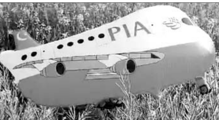
भारत-पाकिस्तान बॉर्डर के पास स्थित गांव में एक बार फिर पाकिस्तानी गुब्बारा मिला।

■ सूचना के बाद बीएसएफ जी ब्रांच और सीआईडी के अधिकारी मौके पर पहुंचे