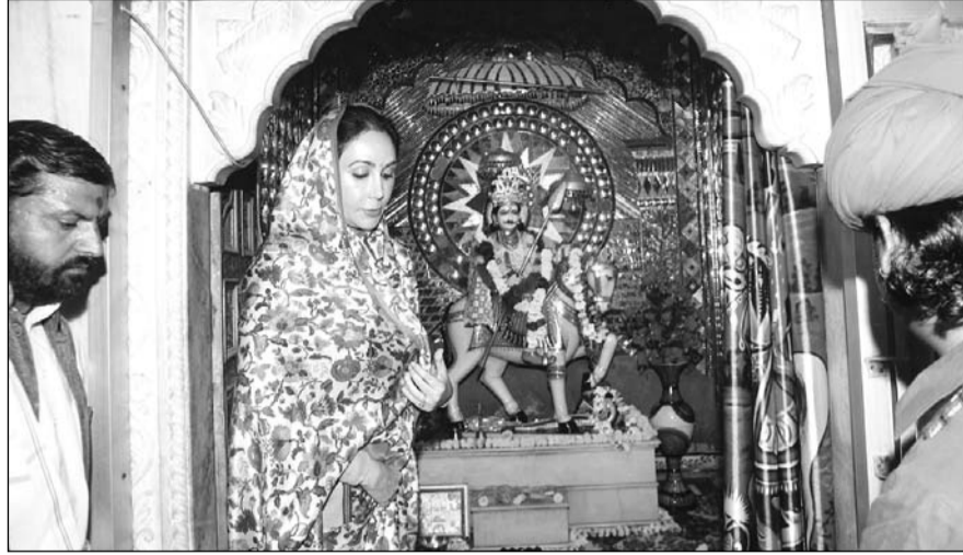
उपमुख्यमंत्री दिया कुमारी ने सर्वाभोज में भगवान श्री देवनारायण जी के दर्शन किये।

उपमुख्यमंत्री ने प्रेमसागर सरोवर के सौंदर्यीकरण, लाइट डेकोरेशन के कार्य व देवनारायण आवासीय बालिका विद्यालय खोलने की घोषणा की