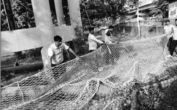
पानी की टंकी पर चढ़े दो बेरोजगारों को सुरक्षित उतारने की कवायद में जुटे आपदा प्रबंधन के कर्मचारी।