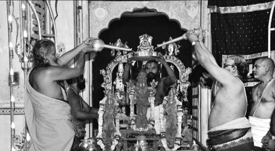
उत्तर भारत की प्रमुख श्री वैष्णव पीठ उत्तर तोदाद्रि मठ श्री गलताजी में ब्रह्मोत्सव के दूसरे दिन विभिन्न दिव्य आयोजन हुए। प्रातः शांति पाठ, द्वारा तोरण पूजन, चतुःस्थान अर्चन, मूलमंत्र व मूर्तिमंत्र हवन किया गया। इसके बाद पंचसूक्त से हवन की पूर्णाहुति की गई।