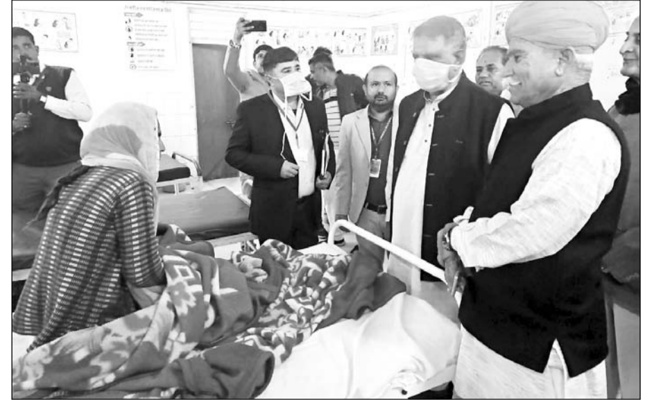
चिकित्सा एवं स्वास्थ्य मंत्री गजेन्द्रसिंह खीवसर ने मरीजों की कुशलक्षेम पूछी।

मंत्री ने मरीजों को बेहतर चिकित्सा सुविधा उपलब्ध कराने के लिए निर्देश