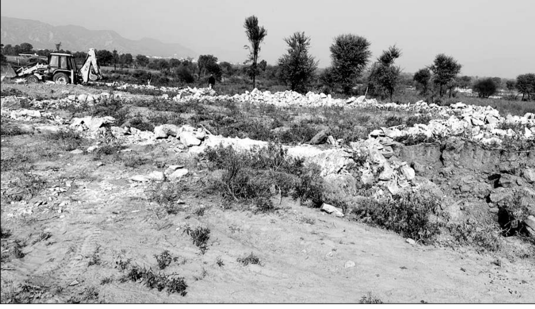
जेडीए की प्रवर्तन टीम ने आगरा रोड स्थित जामडोली में सरकारी भूमि पर हुए अवैध निर्माण को जेसीबी की मदद से हटाया।