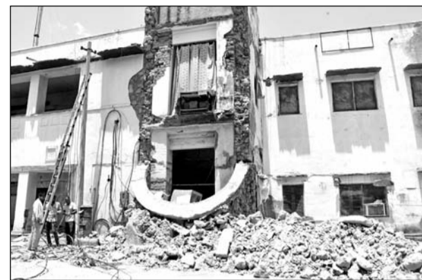
चूरू जिला कलेक्ट्रेट का एक हिस्सा गत रात को अचानक से भरभराकर गिर गया।

चूरू, (कासं)। जिला मुख्यालय पर स्थित कलेक्ट्रेट भवन ही जब सुरक्षित नहीं है तो अन्य पुरानी इमारतों के बारे में तो कुछ कहा ही नहीं जा सकता कब किसी की जिंदगी काल के मुंह में चली जाये। ऐसा ही वाक्या शनिवार को हुआ। यहां पर स्थित जिला कलेक्ट्रेट भवन का एक हिस्सा शनिवार देर रात भरभराकर अचानक से गिर गया। देर रात करीब साढ़े 11 बजे एक ट्रेन के गुजरने के बाद यह भवन गिर गया। इस दौरान मलबे के नीचे दबने से दो कर्मचारी बाल-बाल बच गए। इससे पूर्व भी जिला कलेक्ट्रेट के पीछे बने दो कमरे गिर गये थे। जिससे उसमें रखा रिफाई खराब हो गया था। आपको बता दें कि कलेक्ट्रेट भवन की मरम्मत के लिए राज्य सरकार से 19 करोड़ रुपए का बजट आया है। फिलहाल जो हिस्सा गिरा है, उसमें पोस्ट ऑफिस संचालित था। इससे वहां रखे महत्वपूर्ण दस्तावेजों