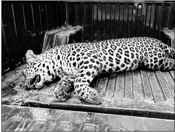
मांडलगढ़ के मेनाल के पास पैंथर का शव नाले में पड़ा मिला।

दरअसल मेनाल से लाडपुर तक घने जंगल के बीच नेशनल हाइवे सड़क मार्ग निकला हुआ है, जंगल में बहुदूरवात मात्रा में वन्यजीवों की संख्या है, लेकिन सड़क पर कहीं अंडरपास नहीं होने से वन्यजीव सड़क पर आ जाते हैं और हादसे का शिकार हो जाते