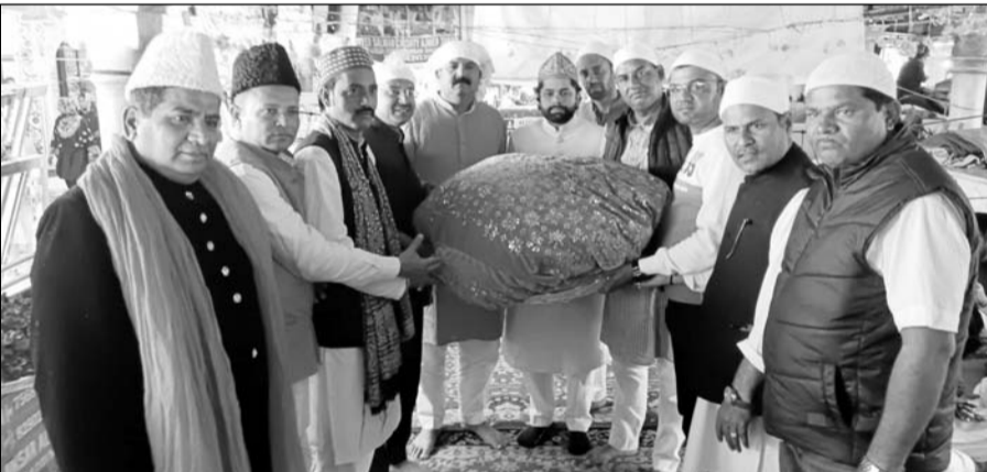
ख्वाजा मोइनुद्दीन हसन चिश्ती के उर्स के मौके पर वसुंधरा राजे की ओर से भेजी गई चादर पेश की।