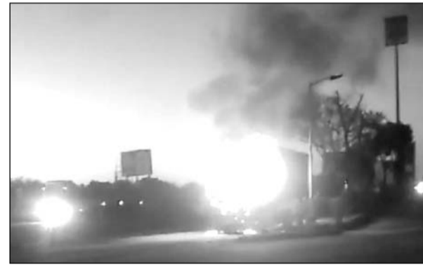
दिल्ली-अजमेर हाइवे पर बिलौची के पास कन्टेनर में आग लग गई।