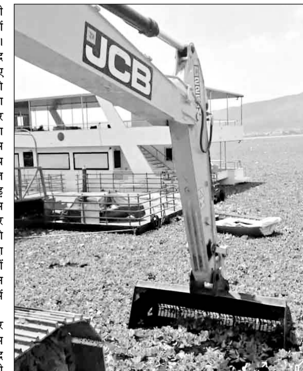
आनासागर झील से मशीनों से जलकुंभी निकली जा रही है।

शहर की ऐतिहासिक आनासागर झील में फैली जलकुंभी को नगर निगम द्वारा निकाल कर झील के रामप्रसाद घाट के सामने खाली भूमि पर डाली जा रही है, जिसके कारण जलकुंभी से रिसाव होकर सड़क पर आ रहे पानी से वाहन चालकों और राहगीरों को परेशानी का सामना करना पड़ रहा है।