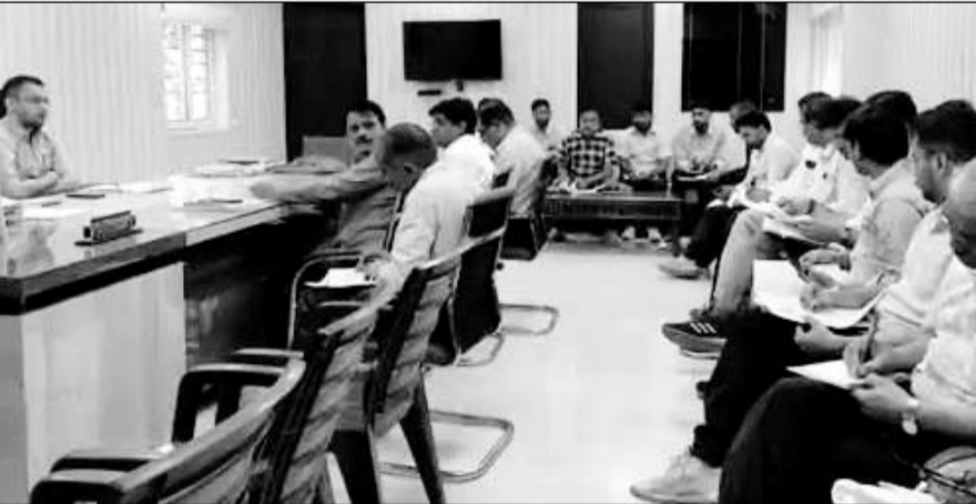
जल एवं स्वच्छता समिति की बैठक लेते जिला कलेक्टर।