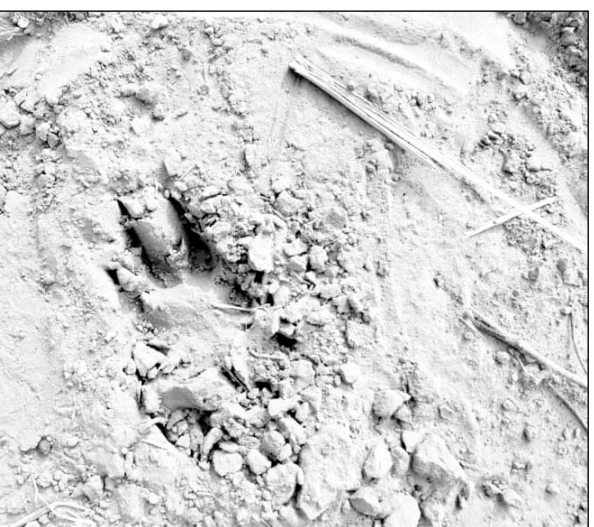
वन विभाग की टीम ने मिले निशान पर पगमार्क लिए।

■ ग्रामीणों के अनुसार बाड़े में कुछ पग मार्क हैं, जिससे लग रहा है कि कोई पैंथर आया था