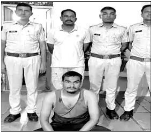
नोखा थाना पुलिस ने चित्तौड़गढ़ के फरार अफीम सप्लायर को नोखा के हिम्मटसर में गिरफ्तार किया।

दो बाइक चोर गिरफ्तार: हनुमानगढ़ जिले की टाउन पुलिस ने दो अलग-अलग मामलों में दो बाइक चोरों को