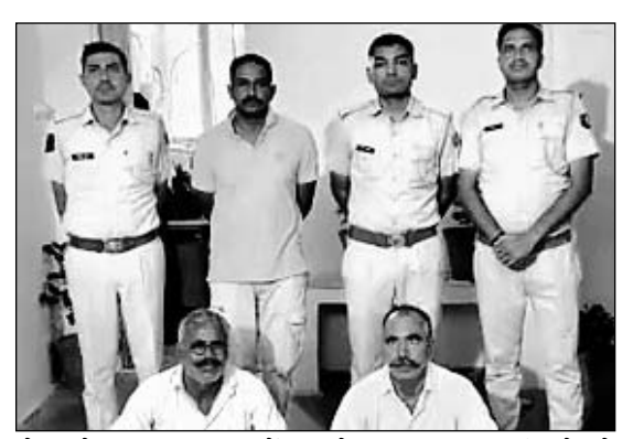
नोखा के गांव हिम्मटसर में जानलेवा हमला व मारपीट के दो आरोपियों को गिरफ्तार किया।