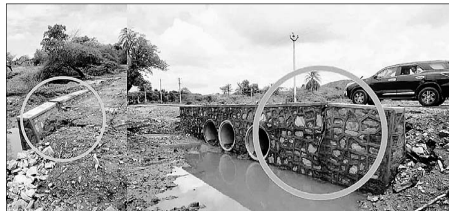
खैरवाड़ा-झूंगरपुर मार्ग पर बारो का शेर के निकट क्षतिग्रस्त निर्माणाधीन पुल की दीवारें।

खैरवाड़ा से झूंगरपुर के बीच बारो का शेर के पास बने पुल के दीवार में अभी से दरारें पड़ गई हैं। जब कि वर्तमान में सारे आवागमन के वाहन बाईपास रोड से जा रहे हैं। ऐसे में यदि बनने के साथ ही पुल क्षतिग्रस्त हो रहे है तो निर्माण कार्य में प्रयुक्त सामग्री घटिया प्रयोग में लाई जा रही है जब कि इस कार्य के