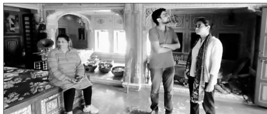
राजस्थान पर्यटन विकास निगम लिमिटेड के सहायक अभियंता ने कस्बे के पर्यटन स्थलों का निरीक्षण किया

मंडावा के ऐतिहासिक स्थलों का विकास होने से पर्यटन को बढ़ावा मिलेगा