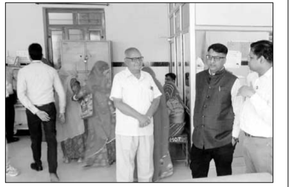
जिला कलेक्टर निशांत जैन ने जिला अस्पताल का औचक निरीक्षण किया।

बीकानेर, (कासं)। जिला कलेक्टर निशांत जैन ने सोमवार को एसडीएम राजकीय जिला चिकित्सालय का औचक निरीक्षण किया। जिला कलेक्टर ने अस्पताल के आपातकालीन वार्ड को देखा तथा यहां हीट वेव/हीट स्ट्रोक से निपटने के लिए की गई तैयारियों का जायजा लिया। अस्पताल के आउटडोर की जानकारी ली तथा पंजीयन कार्डर के पास मरीजों और उनके परिवारों के बैठने के लिए अतिरिक्त बेंचेंज लगाने के लिए निर्देश दिए। उन्होंने कहा कि अस्पताल परिसर में साफ-सफाई व्यवस्था पर अतिरिक्त ध्यान दिया जाए। उन्होंने नेत्र और ईएनटी ओपीडी का अवलोकन भी किया और यहां की व्यवस्थाओं की समीक्षा की। जिला कलेक्टर ने प्रसूति वार्ड और संस्थागत प्रसव की जानकारी ली। इमरजेंसी वार्ड से जुड़े रिकॉर्ड का फीडबैक लिया। दवा वितरण केन्द्र का अवलोकन करते हुए दवाओं की उपलब्धता के बारे में जाना। निःशुल्क जांचों की स्थिति की भी समीक्षा की। जिला कलेक्टर ने अस्पताल के विभिन्न वार्डों का निरीक्षण किया और मरीजों से व्यवस्था संबंधी फीडबैक लिया। उन्होंने हीट वेव वार्ड भी देखा और यहां सभी आवश्यक दवाईयों की उपलब्धता सुनिश्चित करने के निर्देश दिए। जिला कलेक्टर ने कहा कि भीषण गर्मी के मद्देनजर अस्पताल परिसर में शुद्ध पेयजल की व्यवस्था सुनिश्चित हो। इस दौरान जिला कलेक्टर ने अस्पताल में नगर निगम द्वारा संचालित श्री अन्नपूर्णा रसोई का निरीक्षण किया। यहां प्रतिदिन बनने वाले भोजन के बारे में जानकारी ली। उन्होंने भोजन की गुणवत्ता बरकरार रखने के साथ परिसर की साफ-सफाई और बैठने की व्यवस्था को सुदृढ़ करने के निर्देश दिए। इस दौरान जिला अस्पताल अधीक्षक डॉ. सुनील हर्ष ने अस्पताल से जुड़ी विभिन्न व्यवस्थाओं के बारे में बताया।