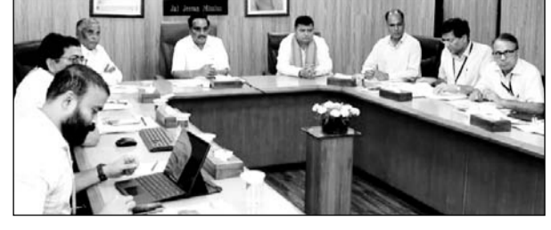
केंद्रीय जल शक्ति मंत्री सी.आर.पाटिल की अध्यक्षता में दिल्ली में सोमवार को हुई जल जीवन मिशन की बैठक में राजस्थान के जलदाय मंत्री कन्हैयालाल व वरिष्ठ अफसर भी शामिल हुए।

बैठक में जल शक्ति मंत्री ने कहा कि केन्द्र सरकार जल जीवन मिशन के तहत "हर घर जल" संकल्प को साकार करने की दिशा में तेजी से आगे बढ़ रहा है, ताकि राजस्थान के हर गांव में शुद्ध पानी पहुंच सके। उन्होंने कहा कि केन्द्र सरकार द्वारा राज्य सरकार को जल जीवन मिशन कार्यक्रम में हर संभव सहयोग किया जाएगा। साथ ही जल जीवन मिशन के तहत प्रदेश में जो कार्य किए जा रहे हैं, उनकी गति बढ़ाये जाने की जरूरत है। राजस्थान के जलदाय मंत्री कन्हैयालाल ने प्रदेश में जल जीवन मिशन के तहत जो कार्य चल रहे हैं उनके बारे में विस्तार पूर्वक अवगत कराया। साथ ही प्रदेश में कार्यक्रम के तहत जो समस्या आ रही है उसके बारे में भी अवगत करते हुए बताया कि प्रदेश में जल जीवन मिशन की अवधि जो मार्च 2024 को समाप्त हो गयी है, उसकी समयवाधि बढ़ाए जाने की मांग की गई। केंद्रीय जल सचिव विनी महाजन ने कहा कि राजस्थान में जल