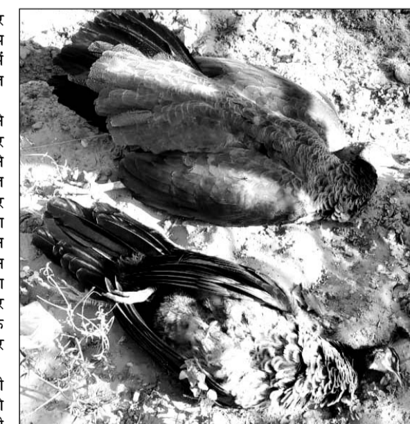
ट्रांसफार्मर की चपेट में आये मोर।