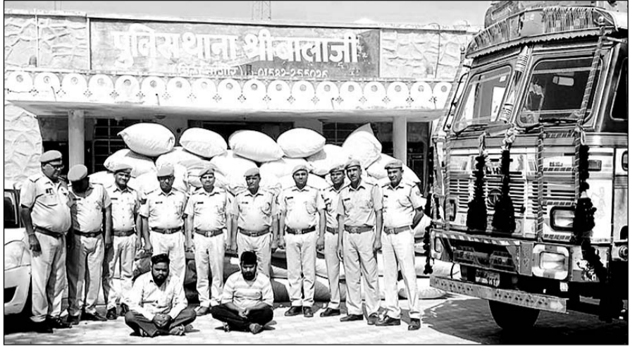
श्रीबालाजी पुलिस थाना के सामने पर नाकाबंदी में ट्रक में से 4622 किलो मादक पदार्थ जब्त किया