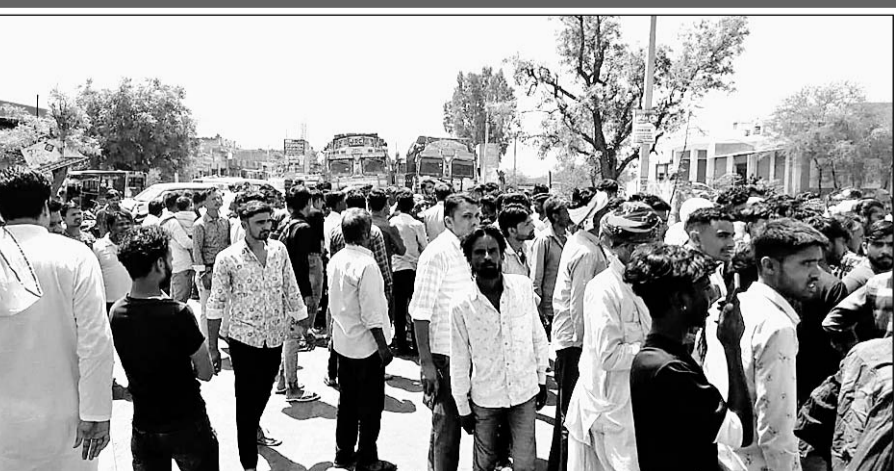
हादसे के बाद दौलतपुरा के ग्रामीणों ने मौके पर पहुंचकर जाम लगा दिया।