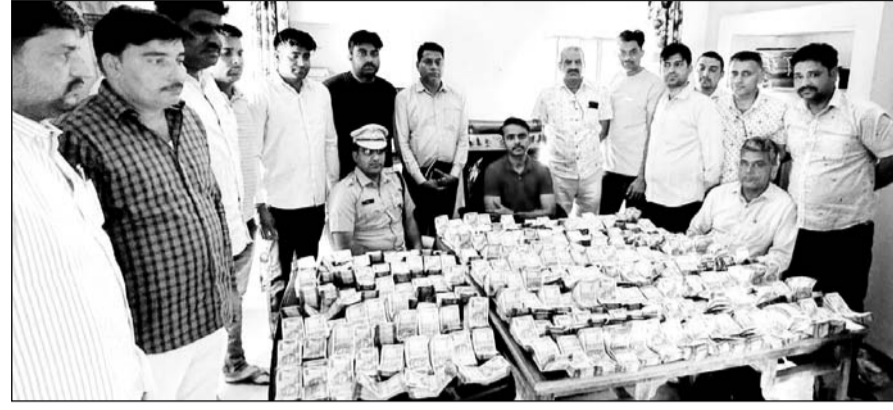
झुंझुनूं पुलिस ने बड़ी कार्रवाई करते हुए करीब डेढ़ करोड़ का कैश जब्त किया।