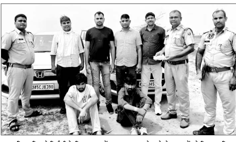
रामनगरिया पुलिस ने फिरोती के लिए 3 युवकों का अपहरण करने वाले दो बदमाशों को गिरफ्तार किया।

जयपुर। रामनगरिया थाना पुलिस ने फिरोती के लिए तीन युवकों का अपहरण करने वाले दो बदमाशों को गिरफ्तार कर तीनों अपहृत युवकों को छुड़वा लिया। आरोपियों ने फिरोती के लिए अपहरण किया था और उनके दोस्त से 5-5 लाख रुपयों की मांग की थी। पुलिस ने उनके कब्जे से पिस्तौल बरामद की है।