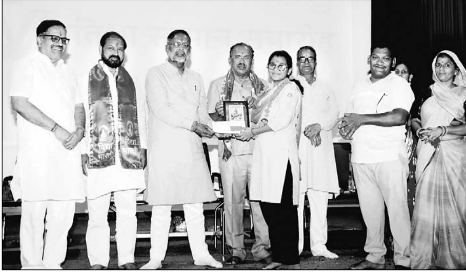
विधानसभाध्यक्ष वासुदेव देवनानी रिवार को कोटा में विद्या भारती शिक्षा संस्थान के प्रतिभा सम्मान समारोह को मुख्य अतिथि के रूप में संबोधित किया।

जयपुर। विधानसभा अध्यक्ष वासुदेव देवनानी ने कहा कि समाज में परिवर्तन लाने के लिए नई पीढ़ी को संस्कारवान बनाना हम सभी की जिम्मेदारी है। नई पीढ़ी को राष्ट्रीयता, देश प्रेम एवं मूल्यों की शिक्षा देकर उनमें देश के लिए समर्पण का भाव उत्पन्न कर हम 2047 तक विकसित भारत का संकल्प पूरा कर सकेंगे। देवनानी रिवार को कोटा में विद्या भारती शिक्षा संस्थान के प्रतिभा सम्मान समारोह को मुख्य अतिथि के रूप में संबोधित कर रहे थे।