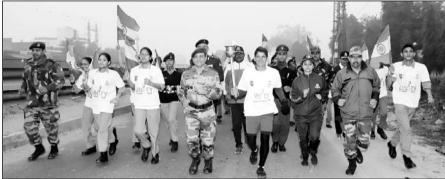
तीन हजार किलोमीटर की दौड़ पूरी कर धौलपुर पहुंची यूनिटी फ्लेम रन टीम को रवाना किया।