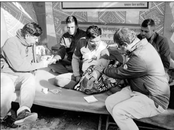
भूख हड़ताल पर बैठे कार्मिकों की डॉक्टर टीम ने जांच की।

मेड़ता सिटी, (निसं)। वेतन विसंगतियों को लेकर मेड़ता जेल में भूख हड़ताल पर बैठे कर्मचारियों में से एक कर्मचारी की तबियत बिगड़ गई। तबियत खराब होने पर मेडिकल टीम मौके पर पहुंची और इलाज किया।