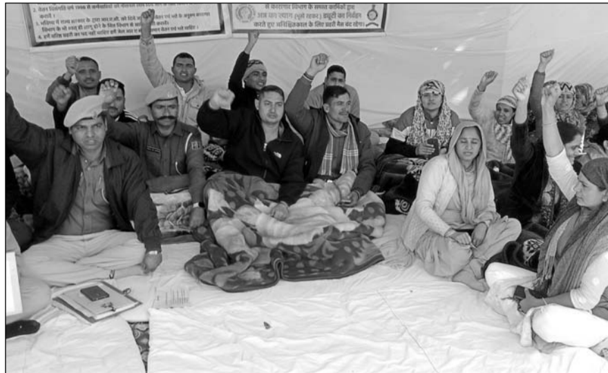
जोधपुर सेंट्रल जेल के बाहर जेल प्रहरियों ने प्रदर्शन किया।

एम.जी.एच. में भर्ती कराए एक अनशनकारी का ऑक्सीजन लेवल कम होने पर उपचार किया