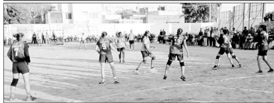
मिर्धा पार्क में जूनियर हैंडबॉल प्रतियोगिता में प्रदर्शन करती छात्राएं।