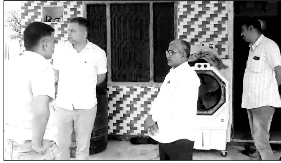
एसीबी ने व्यवस्थापकों को नियमितिकरण के नाम पर लाखों रुपये एंठने के मामले में कार्रवाई की।

■ सहकारी बैंक में करीब 100 व्यवस्थापकों को नियमितिकरण करने का मामला ■ सर्च कार्रवाई कर पूर्व एमडी व कम्प्यूटर ऑपरेटर के घर से दस्तावेज आदि बरामद