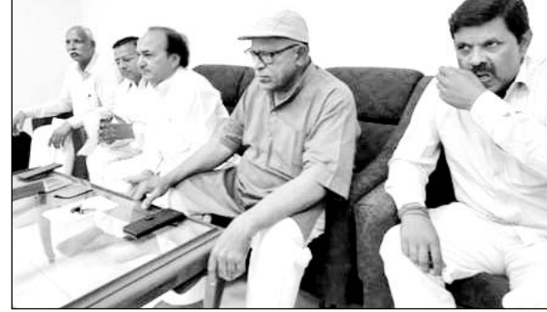
करौली कोतवाली थाने में आयोजित बैठक में पुलिस और प्रशासन के अधिकारी एवं शहर के प्रमुख लोग मौजूद रहे।

करौली, (निसं)। करौली जिला मुख्यालय पर हर वर्ष की भांति इस वर्ष भी रामनवमी की शोभायात्रा निकाली जानी थी लेकिन जिला प्रशासन और पुलिस प्रशासन की हठधर्मिता के