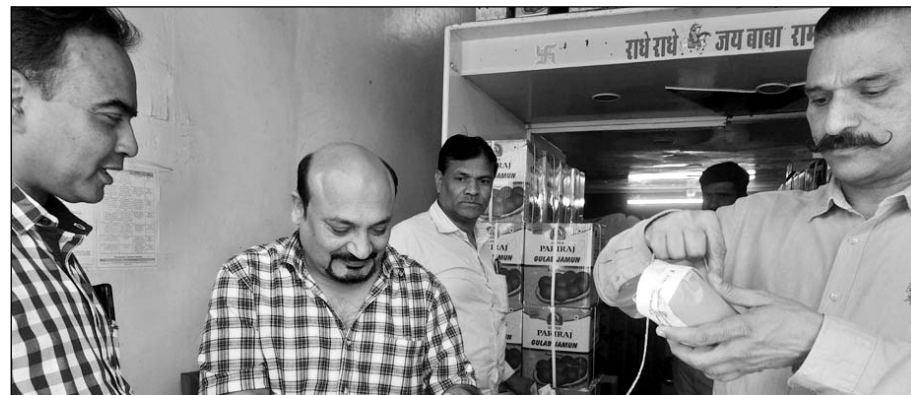
कोटा में खाद्य सुरक्षा विभाग की टीम ने नमूने लिये।

कोटा, (निस)। कोटा में 988 किलोग्राम गुलाब जामुन सीज करने की कार्रवाई की गई। साथ ही विभिन्न खाद्य पदार्थों के 19 नमूने लिये गये हैं।