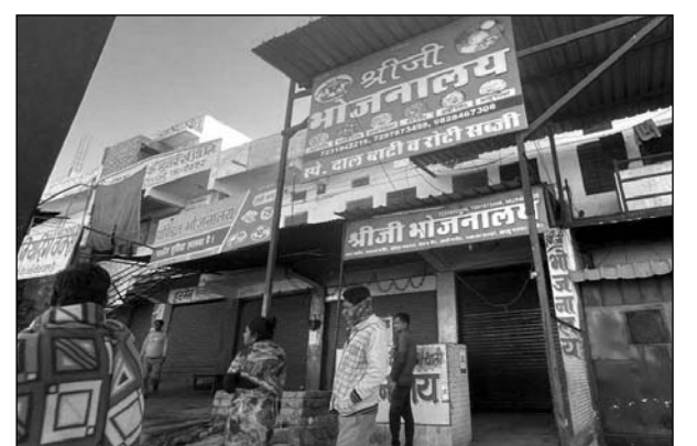
उदयपुर नगर निगम ने नगरीय विकास कर को लेकर कार्रवाई की।

उदयपुर, (का.सं.)। उदयपुर नगर निगम ने बुधवार सुबह नगरीय विकास कर को लेकर कार्रवाई करते हुए एक अपार्टमेंट को सीज किया। व्यवसायिक गतिविधियों वाली इस संपत्ति पर करीब नौ लाख रुपए का टैक्स बकाया था।