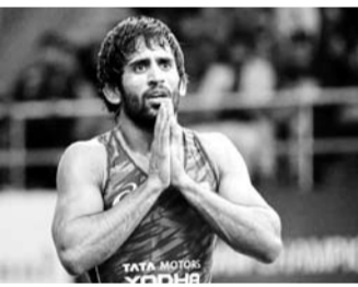
द्वारा दोबारा सस्पेंड किए जाने के एक सप्ताह के बाद अब बजरंग पूनिया ने एक्स पर अपनी चुप्पी तोड़ते हुए अपनी प्रतिक्रिया दी है। साथ ही उन्होंने आरोप लगाया है कि वो नहीं चाहते हैं कि मैं

नई दिल्ली, 1 जुलाई। भारतीय स्टार पहलवान बजरंग पूनिया को नेशनल एंटी डोपिंग एजेंसी (नाडा) ने 23 जुन को दोबारा सस्पेंड कर दिया था। बजरंग को फिर से डोपिंग रोधी नियम के उल्लंघन के मामले में निर्लंबित किया गया था। साथ ही उन्हें नोटिस भेजा गया और इसका जवाब देने के लिए उन्हें 11 जुलाई तक का समय दिया गया। नाडा के