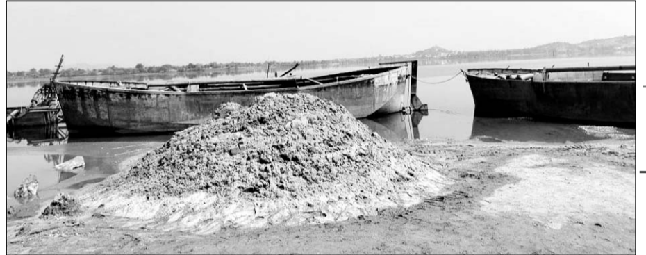
डीएसटी टीम ने अवैध बजरी निकालने पर दो नावों सहित बजरी भी जब्त की।

डूंगरपुर, (निर्सं)। सोम नदी के बैक वाटर एरिया में अवैध बजरी खनन के खिलाफ डीएसटी ने मंगलवार रात को कार्रवाई की। डीएसटी ने बजरी खनन करती हाईटेक नावों के साथ ही डंपर और बुलडोजर को जब्त किया है। अवैध बजरी खनन करने वाले माफिया रात के अंधेरे का फायदा उठाकर मौके से भाग गया।