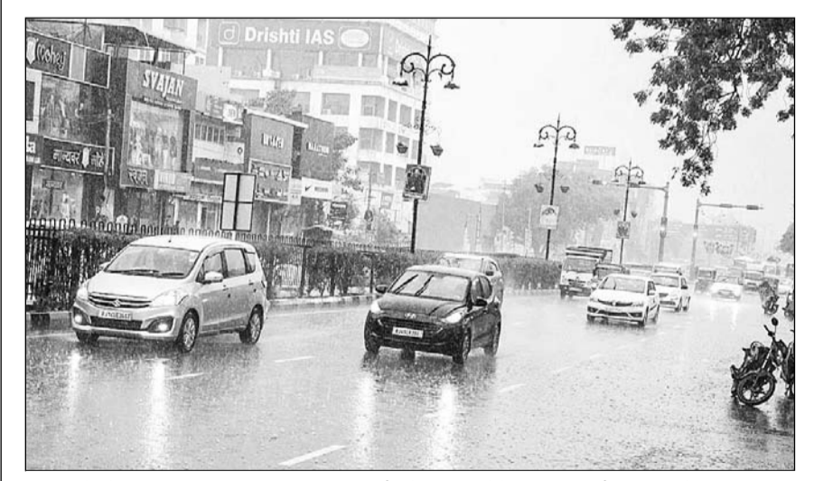
जयपुर में दोपहर बाद काली घटाएं घिर आईं और तेज बर्फा होने लगी। इस दौरान सड़कों पर पानी भर गया और वाहन चालकों को भारी परेशानी का सामना करना पड़ा। वहीं भारी ठंड की वजह से लोग घरों में दुबकने को मजबूर हो गये।