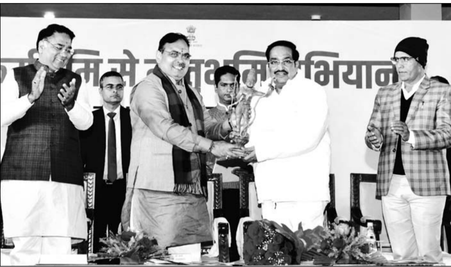
कर्मभूमि से मातृभूमि अभियान के अंतर्गत सांगानेर में मुख्यमंत्री भजनलाल शर्मा ने केंद्रीय जलशक्ति मंत्री सी.आर. पाटिल का स्वागत किया।

पहले प्याऊ बनवाते थे, अब धरती की प्यास बुझाने के लिए रिचार्ज स्ट्रक्चर बनवाएं : सी. आर. पाटिल