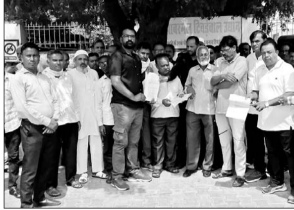
काना पहाड़ी में खनन कार्य को बंद करवाने की मांग को लेकर लोगों ने प्रदर्शन किया।

से बंद है। कोर्ट ने ब्लास्टिंग पर रोक लगाई हुई है। ब्लास्टिंग से हुए गहरे गड्ढे से कई हादसे हो चुके हैं। लेकिन अब लीजधारक फिर से यहां खनन का प्रयास कर रहे हैं। पत्थरों को उठा कर ले जा है। टुक लगे हुए हैं, जो रात दिन पत्थर उठा रहे हैं। चारों तरफ तार बंदी का