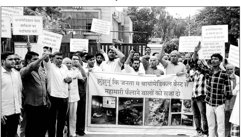
झुंझुनू में प्रस्तावित मेडिकल बायो वेस्ट प्लांट के विरोध में शहरवासी नगर परिषद का गेट बंद कर धरने पर बैठ गए।

2015 में नगर परिषद ने नियमों को ताक पर रखकर इंस्टो मेडिकल बायोवेस्ट मैनेजमेंट प्राइवेट लिमिटेड को बायो मेडिकल वेस्ट के निस्तारण का टेंडर दिया था। लेकिन इस कंपनी ने बायो वेस्ट को उठाया नहीं इस बायो वेस्ट के कारण मोडा पहाड़ में बीमारियों ने घर कर लिया है। जिसके कारण आए दिन लोगों की मौत हो रही है। कंपनी ने झुंझुनू में कहा कि