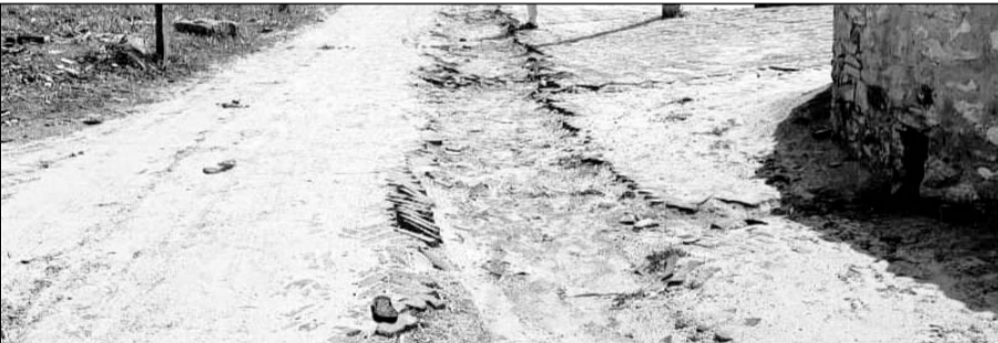
गांव चारिया में सड़क के बीच में जेसीबी से खोदी गयी सड़कें।

सुजानगढ़, (निस)। ग्राम पंचायत मुरडाकिया के चारिया गांव में जेजेएम योजना के तहत घर-घर कनेक्शन के लिए तोड़ी गयी से ग्रामीण परेशान है। ग्रामीणों ने बताया कि जेजेएम योजना में प्रत्येक घर को नल से जोड़ने के लिए गांव की गलियों की खुदाई की गयी थी। "आपणी योजना" के ठेकेदार द्वारा सड़क तोड़ दी गयी लेकिन उनकी मरम्मत नहीं करवायी गयी।