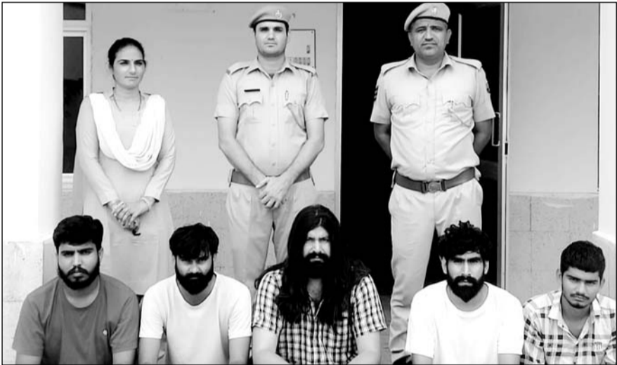
दुधवाखारा पुलिस की टीम ने मारवाड़ 0018 गैंग के पांच सदस्यों को गिरफ्तार किया।