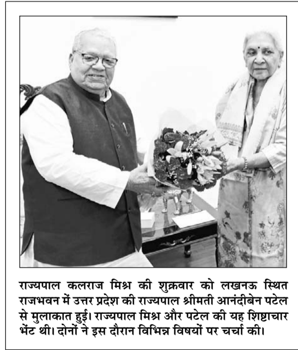
राज्यपाल कलराज मिश्र की शुक्रवार को लखनऊ स्थित राजभवन में उत्तर प्रदेश की राज्यपाल श्रीमती आनंदीबेन पटेल से मुलाकात हुई। राज्यपाल मिश्र और पटेल की यह शिष्टाचार भेंट थी। दोनों ने इस दौरान विभिन्न विषयों पर चर्चा की।