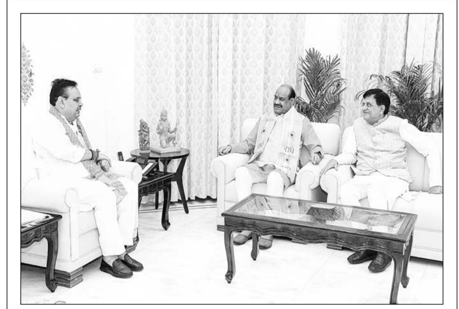
जयपुर में मुख्यमंत्री भजनलाल शर्मा के आवास पर लोकसभा स्पीकर ओम बिरला और केंद्रीय मंत्री पीयूष गोयल ने मुलाकात की। इस दौरान मुख्यमंत्री ने उनका अभिन्दन किया।

उन्होंने कहा कि जिस सरकार को प्रदेश की जनता ने उनकी सहायता के लिए चुना वह सरकार खुद ही असहाय स्थिति में दिख रही है। सरकार को मौत पर राजनीति की बजाय उनका समय पर अंतिम संस्कार करवाकर उनके परिवार की आर्थिक मदद कर उन्हें संभल दे।