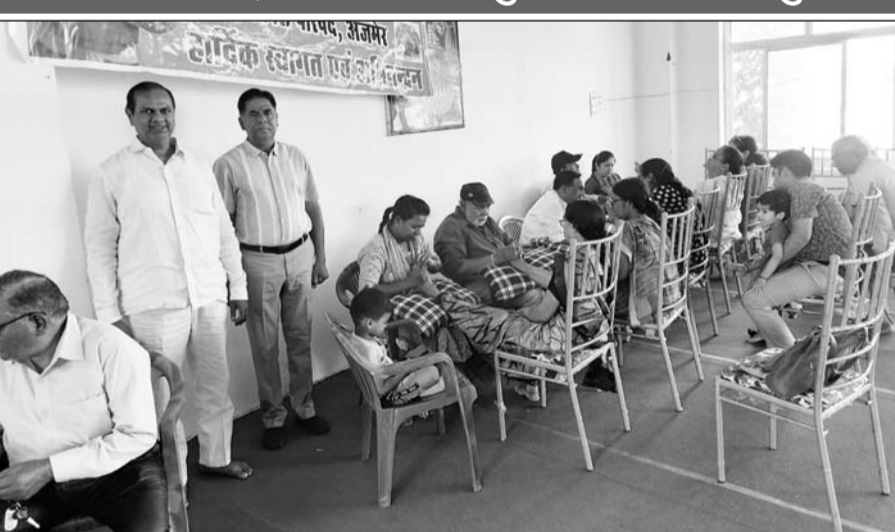
निःशुल्क एक्स्प्रेस चिकित्सा शिविर प्रतिमाह की भांति इस माह भी प्रातः 10 बजे से दोपहर 2 बजे तक धोला भाटा स्थित मन्ना हवेली में आयोजित किया गया।

अजमेर, (कांस)। स्वामी विवेकानंद आरोग्य काया एक्स्प्रेसर योगा मंदिर शाखा भारत विकास परिषद अजमेर एवं अजमेर के संयुक्त तत्वावधान में आयोजित निःशुल्क एक्स्प्रेस चिकित्सा शिविर प्रतिमाह की भांति इस