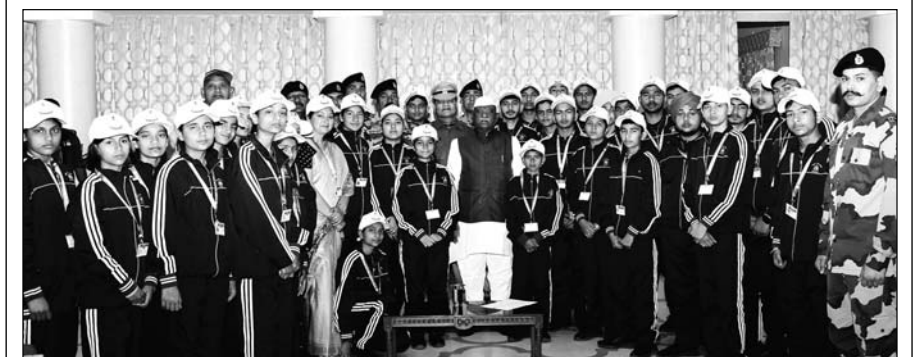
राज्यपाल हरिभाऊ बागडे से शनिवार को राजभवन में भारत दर्शन यात्रा पर आए 35 विद्यार्थियों के दल ने मुलाकात की। सीमा सुरक्षा बल द्वारा आयोजित यह दल जम्मू तवी से जयपुर यात्रा पर आया हुआ है। इस दौरान राज्यपाल से संवाद में उन्होंने भारत दर्शन यात्रा के अपने अनुभव साझा किए। राज्यपाल बागडे ने एक भारत श्रेष्ठ भारत की संकल्पना के अंतर्गत इस तरह की यात्राओं को महत्वपूर्ण बताया। उन्होंने राजस्थान की संस्कृति, वीरता और शौर्य की चर्चा करते हुए गौरवमय अतीत से जुड़े राजस्थान के शौर्य और वीरता के किस्से-कहानियों में यहां के किले-महल्लों और मंदिरों के स्थापत्य के साथ राष्ट्रीयता से जुड़े मूल्यों पर विद्यार्थियों से संवाद किया। भारत दर्शन पर आए 35 विद्यार्थियों के इस दल में 20 लड़कें और 15 लड़कियां सम्मिलित हैं।