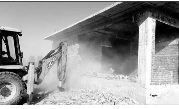
कार्यालय संवाददाता- जयपुर। जेडीए की प्रवर्तन शाखा ने शनिवार को वाटिका रोड पर बड़ी कार्रवाई करते हुए चार अवैध विलाज को तोड़ दिया।

बिल्डर की अपील ट्रिब्यूनल से खारिज होने के बाद शनिवार को प्रवर्तन विंग ने दिखाई सख्ती