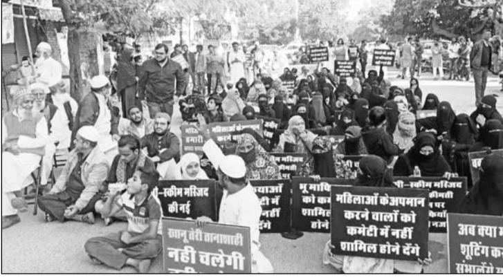
सी-स्कीम स्थित मस्जिद रेजोडेंसी राईयान की कमेटी के विरोध में मुस्लिम समुदाय के महिला-पुरुषों ने सीएम हाऊस के नजदीक सड़क पर बैठक विरोध जताया। उनका आरोप था कि कमेटी में भूमाफिया व मांडलिंग-शूटिंग करने वाले भी शामिल हैं।