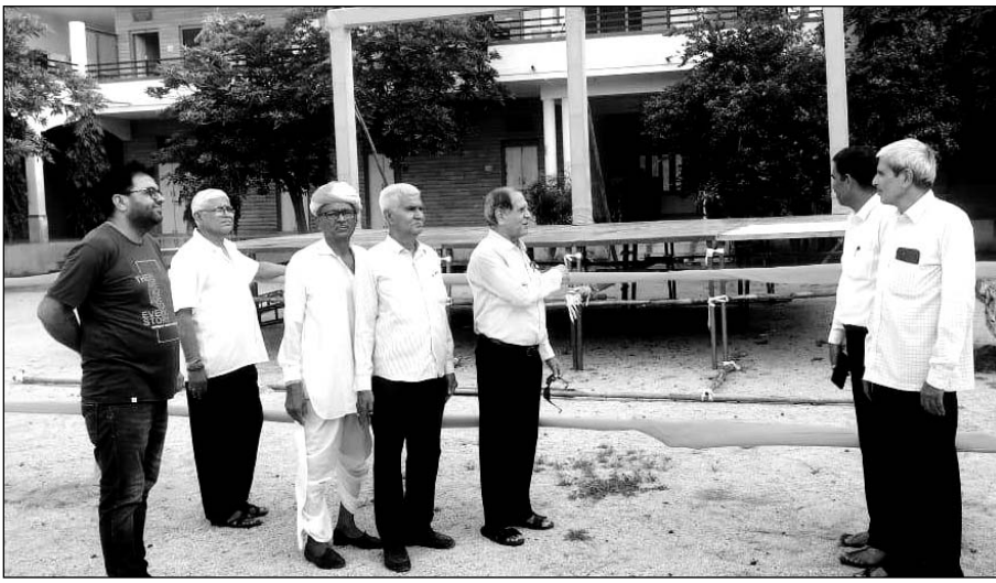
जालोर शहर में स्वामी आत्मानंद महाराज के जन्म शताब्दी महोत्सव को लेकर तैयारियों का जायजा ट्रस्ट महामंत्री और समाजबंधुओं ने लिया।

उन्होंने बताया कि महोत्सव को लेकर शनिवार को सवेरे से ही मंदिर परिसर में श्रद्धालुओं के आने का सिलसिला शुरू हो जाएगा। बैठक में तैयारियों को अंतिम रूप दिया गया। आकर्षक रोशनी से सजाया मंदिरस्वामी आत्मानंद सरस्वती गुरु मंदिर जालोर में दंडी स्वामी देवानंद सरस्वती