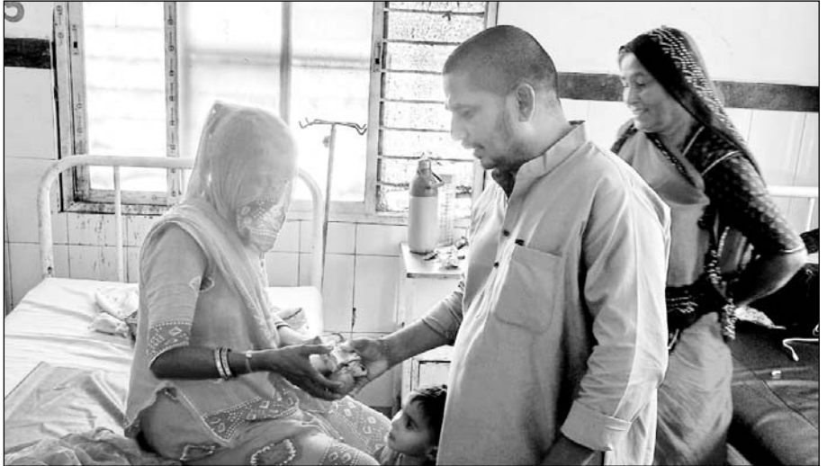
जालोर में भाजपा एस.टी. मोर्चा के जिला मंत्री ने राज्यसभा सदस्य चुन्नीलाल गरासिया के जन्म दिवस पर चिकित्सालय में मरीजों को फल वितरित किए।

जालोर, (कांस)। राज्यसभा सदस्य एवं एस.टी. मोर्चा के राष्ट्रीय उपाध्यक्ष, भाजपा राजस्थान के प्रदेश उपाध्यक्ष चुन्नीलाल गरासिया के जन्मदिन के अवसर पर एस. टी. मोर्चा जालोर के