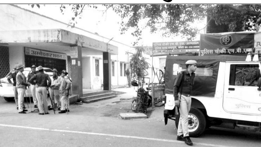
फायरिंग के आरोपी के सुसाइड के बाद अस्पताल परिसर को पुलिस छावनी में तब्दील कर दिया।