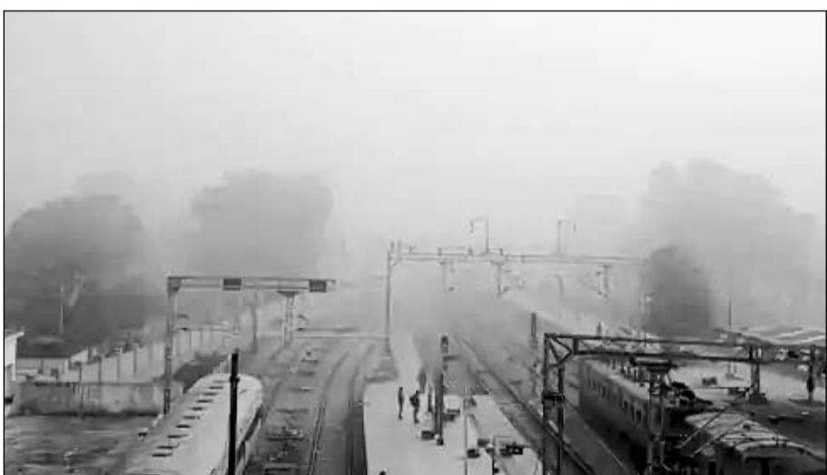
गंगापुर सिटी में रविवार को कोहरा छाने से दृष्टता कम हो गई।

गंगापुर सिटी। एकबार फिर से सर्दी ने अपना रूप दिखाया शुरू कर दिया है। रविवार सुबह से छाप घने कोहरे ने जनजीवन को प्रभावित किया। कोहरे के कारण विजिबिलिटी 30-40 मीटर तक सीमित रही।