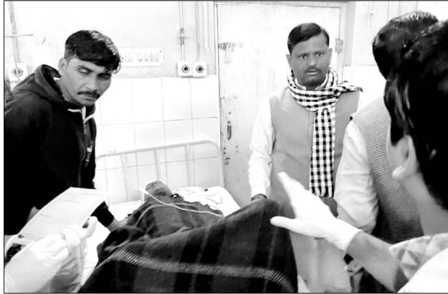
घायल सवारियों का अस्पताल में चिकित्सकों ने उपचार किया।

चाकसू, (निर्स)। चाकसू इलाके के फागी स्टेट हाइवे-2 पर कादेड़ा गांव के पास सवारियों से भरी राजस्थान रोडवेज की एक बस अनियंत्रित होकर सड़क पर पलट गई। हादसे में बस के सवार करीब दो दर्जन से ज्यादा सवारियां घायल हो गईं। हादसे में एक तीन महिने की मासूम बच्ची की मौत हो गई। सूचना पर पुलिस मौके पर पहुंची और घायलों को उपजिला अस्पताल में भर्ती करवाया। गंभीर हालत होने पर करीब 1 दर्जन घायलों को जयपुर रेफर किया गया है। सूचना पर स्थानीय विधायक रामावतार बैरवा भी मौके पर पहुंचे और घटना की जानकारी लेते हुए घायलों से हाल-चाल लेते हुए त्वरित उपचार व्यवस्थाओं पर जुट गए।