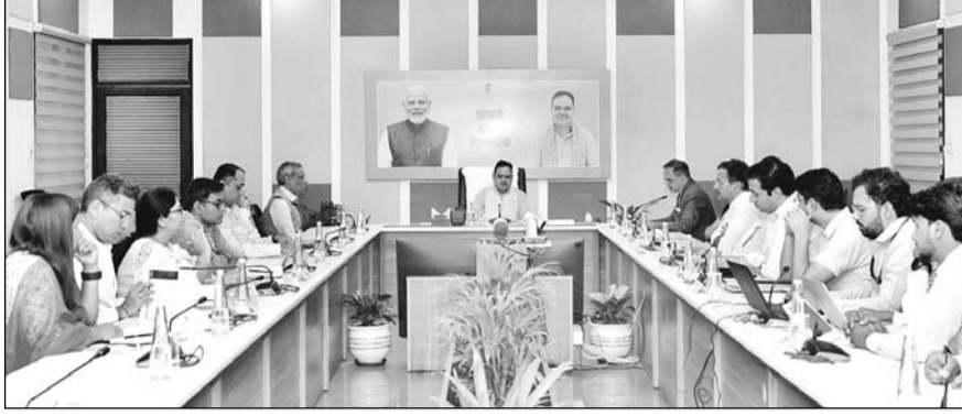
मुख्यमंत्री भजन लाल शर्मा ने अधिकारियों के साथ बैठक कर स्वास्थ्य, ग्रामीण विकास, शिक्षा, पेयजल संबंधी दिशा निर्देश दिए।

इस योजना के अंतर्गत राज्य को वित्तीय वर्ष 2025-26 में 10 हजार 548 करोड़ की राशि प्राप्त हुई है,