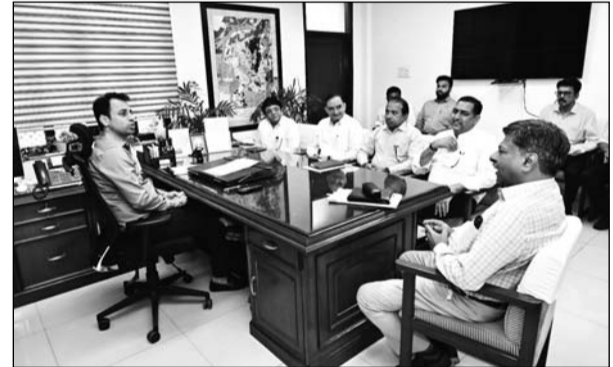
अधिकारियों के साथ औपचारिक बैठक लेकर ली विभिन्न परियोजनाओं की जानकारी।