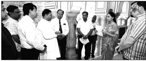
जयपुर विवाह स्थल समिति, जयपुर के पदाधिकारीओं ने उप मुख्यमंत्री दिया कुमारी को मांगों को लेकर ज्ञापन सौंपा।

जयपुर, (निस)। आज सिटी पैलेस में जयपुर विवाह स्थल समिति, जयपुर के पदाधिकारीओं ने उप मुख्यमंत्री दिया कुमारी को ज्ञापन पत्र देकर नगर निगम द्वारा विवाह स्थलों पर पार्किंग अनिवार्य करने के नियम में राहत देने का अनुरोध किया।