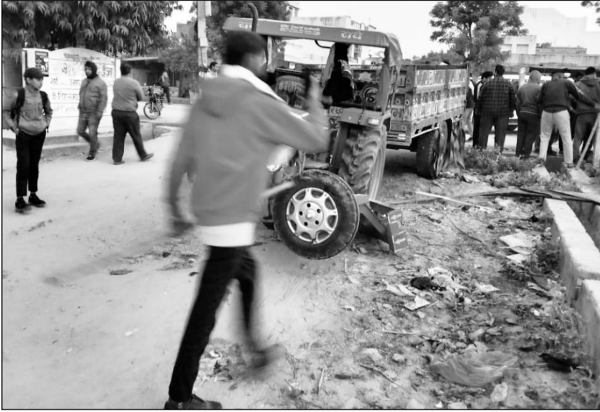
नाका धारक के वाहनों को टक्कर मारने के बाद क्षतिग्रस्त हुआ ट्रैक्टर व मौके पर जमा भीड़।

शुक्रवार को देवली शहर सहित हनुमान नगर थाना क्षेत्र में चर्चा का विषय यह रहा कि गुरुवार को प्रातः शहर के गौरव पथ रोड पर एक साथ पांच बोलोरो वाहन एक ट्रैक्टर का पीछा कर रहे थे। अवैध बजरी कार्य में लिप्त ट्रैक्टर के पीछे बोलोरो तेज गति से दौड़ती हुई ट्रैक्टर के सामने रुक गई तभी ट्रैक्टर चालक ने बोलोरो को भयंकर टक्कर मारकर नाले में फेंक दिया और ट्रैक्टर के आगे के पहिया ट्रैक्टर रोड पर बिखर गये। इस दौरान पांचों लीज धारक के 20 से 25 श्रमिक ने हाथ में लठ लेकर ट्रैक्टर चालक को पकड़ने का प्रयास किया लेकिन ट्रैक्टर चालक