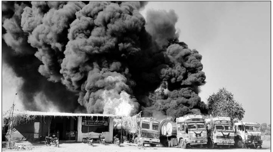
बाँयोडीजल रिफिल करने के दौरान हुई स्पार्किंग के बाद लगी आग से वाहन जलने लगे।

आग की लपटें और धुँआ मानो आसमान छूने की कोशिश करने लगे जो शहर से भी दिखाई दे रहा था। श्री सीमेंट और अग्निशमन को सूचित किये जाने के बाद आग बुझाने के भरसक प्रयास किये जा रहे थे लेकिन वो काबू में ही नहीं आ रही थी। चारों वाहन और आसपास खड़े अन्य ट्रेलर भी बंद खिड़की दरवाजे के खड़े थे। घटनास्थल के आसपास खड़े ट्रेलरों को भी जैसे जैसे जानकार लोगों द्वारा चालू करने के बाद दूर खड़ा करवाया गया जैसे जैसे लोगों को खबर लगी हज़ारों की भीड़ लग गई जिसे पुलिस द्वारा बलपूर्वक हटाया गया। वहां खड़ी मोटर साइकिलों के मालिक भी नहीं मिले जबकि सभी के हेंडिल