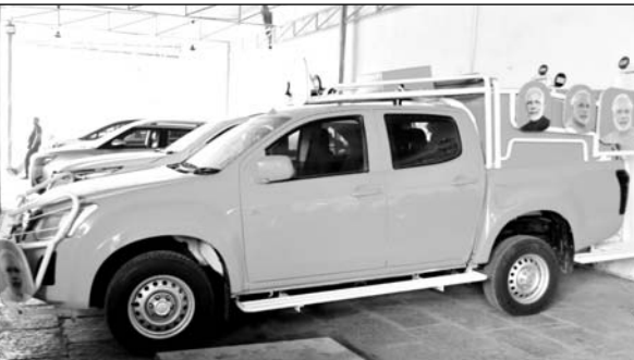
प्रधानमंत्री नरेंद्र मोदी के रोड शो के लिए तैयार रथ।

जयपुर, (कासं)। प्रधानमंत्री नरेंद्र मोदी के मंगलवार को जयपुर में होने वाले रोड शो को लेकर पुलिस और एसपीजी ने मोर्चा संभाल लिया है। वहीं यातायात की विशेष व्यवस्था की गई है। सुरक्षा के लिहाज से सोमवार को परकोटे में रिहसल के दौरान कई रास्तों को बंद कर दिया गया है। इससे एमआई रोड और टोंक रोड सहित कई रास्तों पर ट्रैफिक डायवर्ट करने से जाम की स्थिति बन गई।