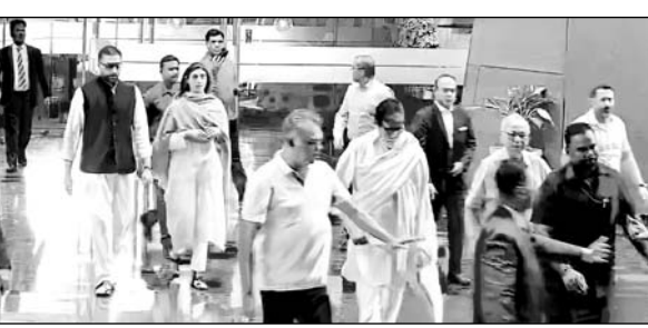
सहाराश्री के निधन के तत्काल बाद अभिनेता अमिताभ बच्चन और अभिषेक बच्चन व श्वेता बच्चन ने मुंबई के सहारा स्टार होटल पहुंचकर श्रद्धांजलि अर्पित की।

जयपुर। सहारा इंडिया परिवार के प्रबंध कार्यकर्ता और चेयरमैन सुब्रत रॉय सहारा, जिन्हें प्यार से सहाराश्री कहा जाता है, को हर क्षेत्र के लोगों से भावभीनी श्रद्धांजलियां प्राप्त हुई हैं। उन्हें राजनेताओं, खिलाड़ियों और फिल्मी सितारों ने श्रद्धांजलि दी। उत्तरप्रदेश के मुख्यमंत्री योगी आदित्यनाथ ने सहाराश्री के निधन पर गहरा दुख व्यक्त किया है जबकि उत्तर प्रदेश के पूर्व मुख्यमंत्री अखिलेश यादव ने उनके निधन को राज्य और देश की भावनात्मक क्षति बताया क्योंकि सहाराश्री केवल एक बड़े हृदय के इंसान थे जिन्होंने अनगिनत लोगों की सहायता की और उन्हें आवश्यक सहयोग प्रदान किया। सहाराश्री का निधन 14 नवंबर को रात 10.30 बजे मुंबई के कोकिलाबेन