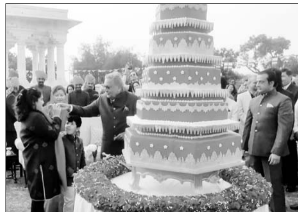
नागरिकों, जन प्रतिनिधियों व अधिकारियों ने शुभकामनाएं दीं।