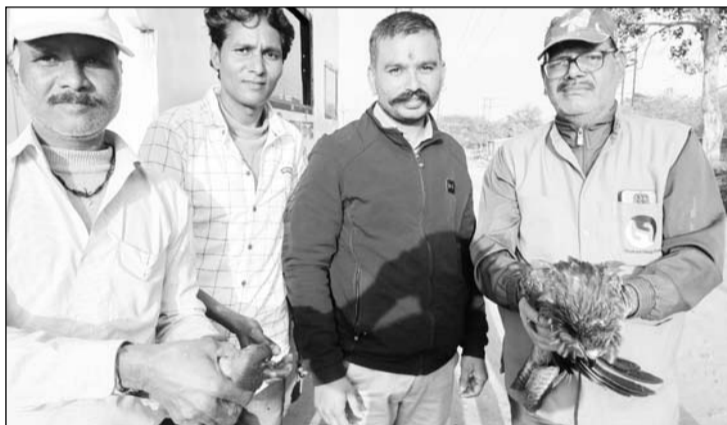
कोटा में डॉक्टर की मदद करते पक्षी प्रेमी।