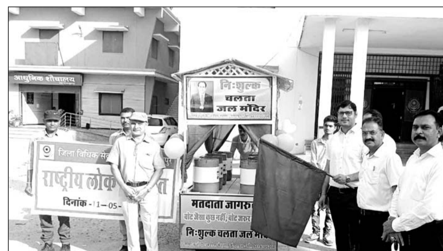
शहर में चलित प्याऊ का हरी झण्डी दिखाकर रवाना करते जिला कलक्टर।