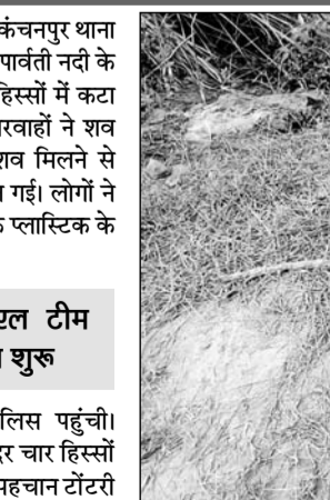
पार्वती नदी किनारे चार हिस्सों में कटा हुआ शव प्लास्टिक के बैग से बरामद हुआ।

बताया जाता है कि दस साल पहले यह पुजारी धर्मांतरण करके हिन्दू बना था