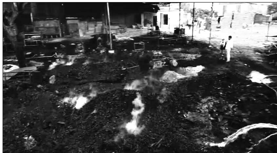
जयपुर ग्रामीण जिले के कालाडैरा रीको औद्योगिक क्षेत्र में सोमवार अल सुबह अचानक प्लाइवुड फैक्ट्री में आग लग गई, जिससे फैक्ट्री में रखी हजारों रुपए की प्लाइवुड व लकड़ी का कचरा राख हो गया।