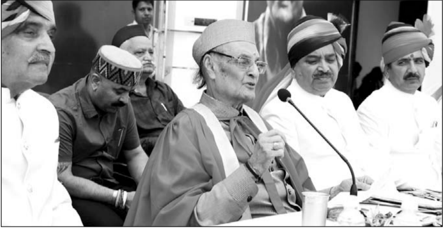
दीक्षांत समारोह को पूर्व केंद्रीय मंत्री व राज्यसभा सदस्य डॉ. कर्णसिंह ने संबोधित किया।

उदयपुर, (कासं)। उच्च शिक्षा में गुणवत्ता और शोध को प्रोत्साहित करने के लिए समर्पित उदयपुर के भूपाल नोबल्स विश्वविद्यालय के प्रथम दीक्षांत समारोह का आयोजन गुरुवार को भूपाल नोबल्स संस्थान के महाराणा प्रताप खेल मैदान पर सम्पन्न हुआ, जिसमें देशभर से प्रतिष्ठित अतिथियों की उपस्थिति रही। दीक्षांत समारोह बेटियों के नाम रहा। 147 में से 131 स्वर्ण पदक बेटियों को मिले तो सबसे चहरे खिल उठे। समारोह में 224 को पीएच.डी की उपाधि प्रदान की गई जिसमें से 154 बेटियों के नाम रही। इसमें भी 68.75 प्रतिशत अर्थात 154 पीएचडी सिर्फ बेटियों ने प्राप्त कर पचरम फहरा दिया।