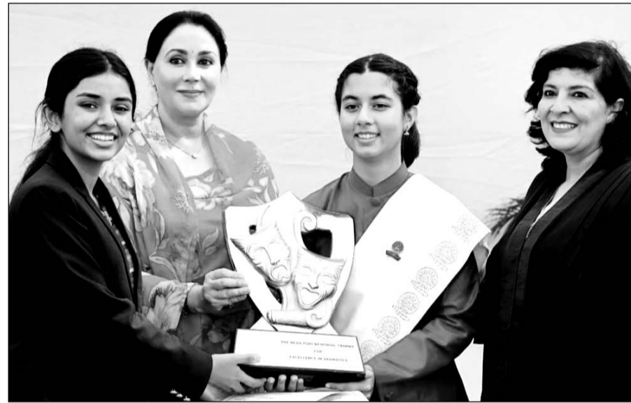
डिप्टी सीएम दीया कुमारी ने छात्राओं को ट्रॉफी प्रदान की।

मेयो कॉलेज में रविवार को आयोजित वार्षिक पारितोषिक वितरण समारोह में डिप्टी सीएम दीया कुमारी ने शिरकत की। इस अवसर पर उन्होंने कहा कि बालिकाएं देश के भविष्य को आकार देने वाली बनेंगी। उन्होंने कहा कि छात्राएं भारत के भविष्य में समाज की पथ प्रदर्शक बनेंगी। इनके द्वारा अपनी मेधा एवं नैतिकता के बल पर देश के भविष्य को आकार देने में महत्वपूर्ण भूमिका निभाई जाएगी। इनके द्वारा प्रदेश और देश का नाम रोशन किया जाएगा। दीया कुमारी ने कहा कि बेटियों ने देश का नाम रोशन किया है। मेयो कॉलेज गर्ल्स स्कूल को बेस्ट रेजिडेंशियल स्कूल का खिताब मिला है, इसके लिए सभी बधाई दी। समारोह में पेरिस ओलम्पियन 2024 दोहा (करर) में आयोजित शांटगन ओलिंपिक क्वालीफिकेशन चैम्पियनशिप में रजत पदक विजेता, इंडियन स्कोट