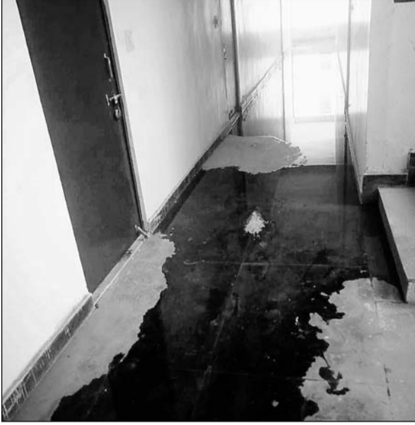
प्रताप नगर सेक्टर-28 में मुख्यमंत्री आवास योजना के तहत ई.डब्ल्यू.एस. और एल.आई.जी. श्रेणी के आवासों का निर्माण कार्य अभी अधूरा है। घटिया कार्य के कारण यहां पाइप लिकेज से पानी का रिसाव होकर यह तैयार फ्लैट्स के सामने से बह रहा है।