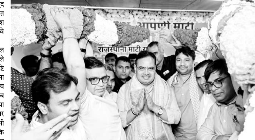
पश्चिम बंगाल के हावड़ा में प्रवासी राजस्थानी सम्मेलन में पहुंचे मुख्यमंत्री भजनलाल शर्मा का गर्मजोशी के साथ भव्य स्वागत किया गया।

हावड़ा। मुख्यमंत्री भजन लाल शर्मा ने कहा कि खुद को दुनिया की महाशक्ति कहने वाले देश आज भारत की बढ़ती हुई ताकत से चबराते हुए हैं। सभी देश भारत की तरफ दोस्ती का हाथ बढ़ा रहे हैं क्योंकि वे जानते हैं कि आने वाला समय भारत का है। उन्होंने कहा कि प्रधानमंत्री नरेंद्र मोदी के कुशल नेतृत्व में आज भारत चहुंमुखी प्रगति कर रहा है। पिछले 10 वर्षों में मोदी के कुशल नेतृत्व में देश आर्थिक दृष्टि से 11वें स्थान से ऊपर उठकर पांचवें पायदान पर आ गया है और आने वाले 2 साल में तीसरे स्थान पर पहुंच जाएगा। शर्मा ने कहा कि वह दिन दूर नहीं जब प्रधानमंत्री के नेतृत्व में भारत आर्थिक दृष्टि से दुनिया का नंबर वन देश बन जाएगा। मुख्यमंत्री शर्मा बुधवार को पश्चिम बंगाल के हावड़ा में प्रवासी राजस्थानी सम्मेलन को सम्बोधित कर रहे थे। उन्होंने कहा कि पश्चिम बंगाल में टीएमसी के शासनकाल में आए दिन दंगे और हिंसा की घटनाएं हो रही हैं। हाल ही में संदेश खाली में महिलाओं के साथ हुए अत्याचार को पूरे देश ने देखा है। ममता बनर्जी के नेतृत्व में टीएमसी सरकार तुष्टीकरण के आधार पर चल रही है।