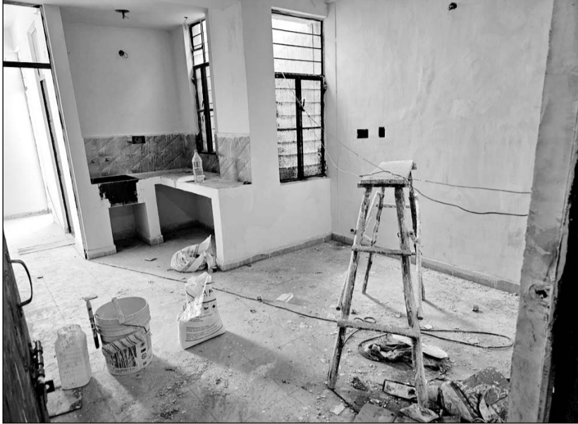
प्रताप नगर सेक्टर-28 में मुख्यमंत्री आवास योजना के तहत ई.डब्ल्यू.एस. और एल.आई.जी. श्रेणी के आवासों का निर्माण कार्य अभी अधूरा है। घटिया कार्य के कारण यहां पाइप लिकेज से पानी का रिसाव होकर यह तैयार फ्लैट्स के सामने से बह रहा है।

-कार्यालय संवाददाता- जयपुर। प्रताप नगर सेक्टर-28 में मुख्यमंत्री जन आवास योजना के तहत गरीब लोगों के लिए 1 हजार फ्लैट्स निर्माण में भारी गफलत चल रही है। ईडब्ल्यूएस और एल.आई.जी. श्रेणी के 1 हजार से अधिक आवासों में से अभी तक मात्र 400 का पंजेशन दिया गया है, 600 से ज्यादा आवास अभी अधूरे पड़े हैं। सूत्रों की मानें तो मैसर्स आर.जे.बी. को ईडब्ल्यूएस के करीब 525 तथा मैसर्स आनंदीलाल लालपुरिया कंस्ट्रक्शन कंपनी को करीब 576 एल.आई.जी. श्रेणी के फ्लैट्स तैयार करने हैं। दोनों कंपनियों को यह काम करीब 50 करोड़ रु. में दिया गया है। अप्रैल-2023 तक इन फर्मों को फ्लैट्स तैयार करके हारुसिंग बोर्ड को सौंपना था, लेकिन निर्धारित समय के 1 साल बाद भी यह प्रोजेक्ट्स अधूरा पड़ा हुआ है।