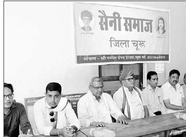
चूरू के सैनी समाज छात्रावास में श्रीफुले आरक्षण संघ समिति की ओर से प्रेस कॉन्फ्रेंस का आयोजन किया गया।