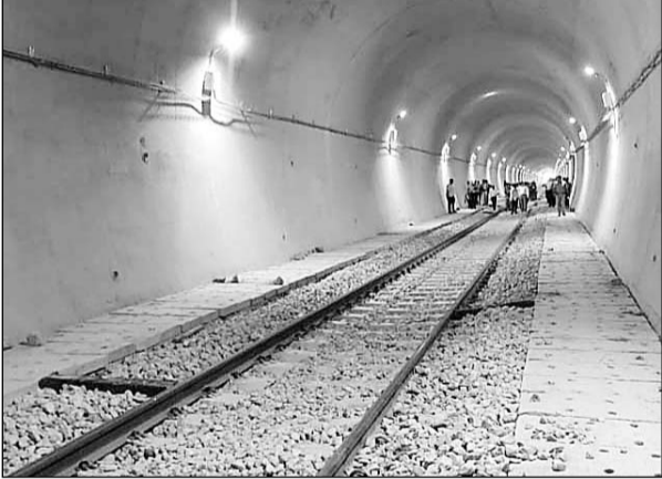
उदयपुर में उदयपुर-अहमदाबाद ब्रॉडगेज के खारवाचांदा-जयसमंद के सीआरएस निरीक्षण का काम दो दिन में पूरा हुआ। अब इसकी रिपोर्ट के आधार पर यह ट्रेन चलाई जाएगी।

परिवर्तन खुलने की राह में यह आखिरी सीआरएस था जिसे पूरा कर लिया गया