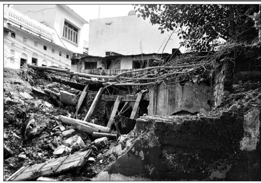
देवली शहर के बीचों-बीच जर्जर अवस्था में खड़े भवन हादसे को न्योता दे रहे हैं।