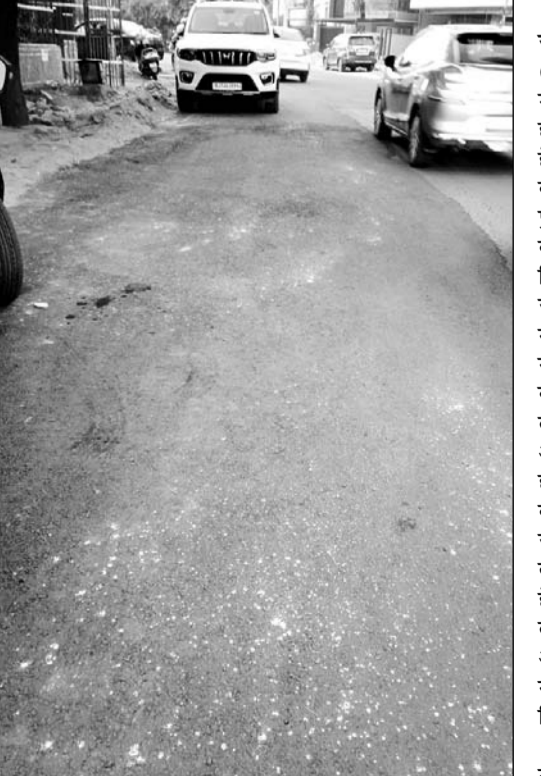
पृथ्वीराज नगर क्षेत्र की कॉलोनियों और मुख्य मार्ग पर हाल ही में जे.डी.ए. द्वारा किए गए पेचवर्क में डामर की मोटी परत चढ़ाकर पुरानी सड़क का अलाइनमेंट ही बिगाड़ दिया गया है।

पेचवर्क के नाम पर सड़कों का अलाइनमेंट बिगाड़ रहे ठेकेदार, जिम्मेदार इंजीनियर्स मौन!