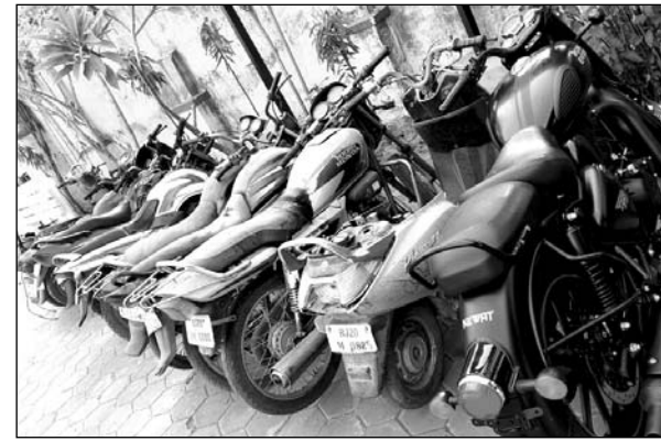
कबाड़ियों के पास कागजात नहीं मिलने पर 10 दुपहिया वाहनों को थाने पर लाकर खड़ा किया।