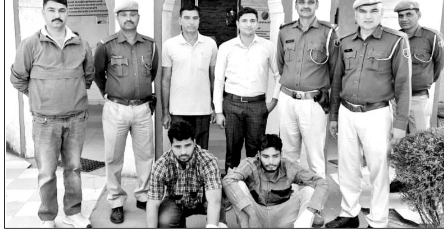
पुलिस ने दोनों आरोपियों को गिरफ्तार कर चोरी की वारदातों का खुलासा किया।