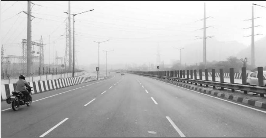
लेकसिटी में कोहरे के बीच सबसे सर्द दिन बीता। तापमान में पांच डिग्री की गिरावट।

झीलों के शहर में सर्द हवाओं ने एक बार फिर तापमान में कमी ला दी है। उदयपुर-चितौड़गढ़ हाइवे पर घना कोहरा दिखाई दिया। कोहरे के कारण कई फ्लाइट्स उदयपुर देती से पहुंची वहीं ट्रेने भी नियमित समय से लेट आ रही हैं। कोहरे के कारण चारों