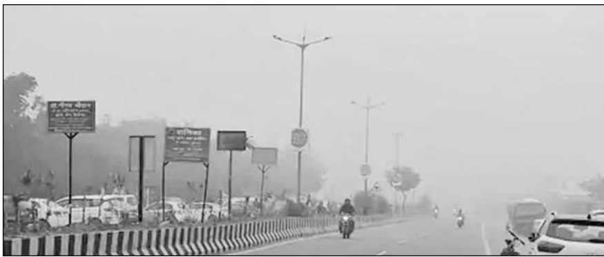
कोहरे की चपेट में अजमेर शहर की सड़कें।

ठंड के कारण लोग घरों में कैद होने को मजबूर हो गए हैं। सोमवार को अजमेर में अधिकतम तापमान 17 डिग्री सेल्सियस और न्यूनतम तापमान 8 डिग्री सेल्सियस रिकॉर्ड किया गया। वहीं आंठरा का स्तर 7.8 प्रतिशत रहा। तेज हवाओं ने ठंड का असर और बढ़ा दिया। सुबह और शाम के समय गलन के कारण टिड्डुर और