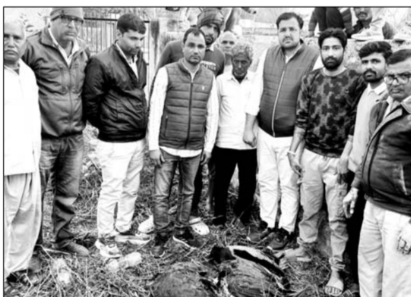
मृत मोर मिलने पर लोगों ने आक्रोश जताया।